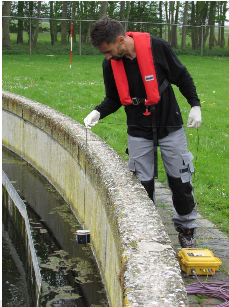
Foto: Aanbrengen meetelektrode.