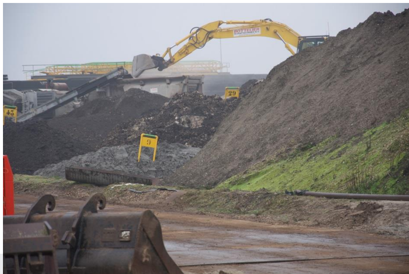
Foto: Risico op energieoverslag.

Voorafgaand aan de geo-elektrische meting moet worden beoordeeld of een energie overslag van de te inspecteren voorziening kan plaatsvinden, die de meting beïnvloedt. Als er getwijfeld wordt of energieoverslag plaats kan vinden, dan kan vooraf op locatie een testmeting of nader onderzoek ter plaatse van de rand worden uitgevoerd.